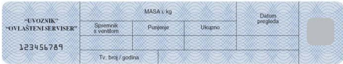
Slika 1. a