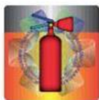
Slika 5. Izgled holograma u prirodnoj veličini